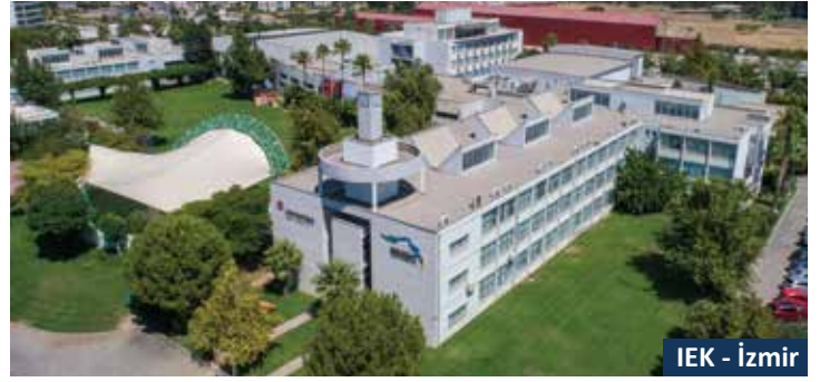
IEK - İzmir

İşikkent'teki eğitim deneyimi öğrenci odaklıdır ve öğrencilerin fiziksel ve ruhsal olarak güvende hissettiği bir ortamda entelektüel, sosyal, duygusal ve fiziksel olarak sürekli gelişmelerini sağlar.